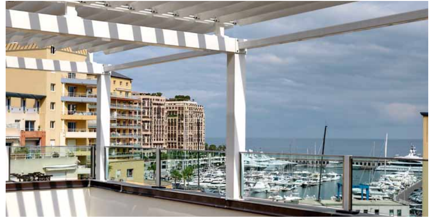
Baie Marquet, Cap d'Ail (France), 2012 - project by Longo Palmarini Architecture & Partners

The typical features of Mediterranean architecture come to life in the residential project Baie Marquet